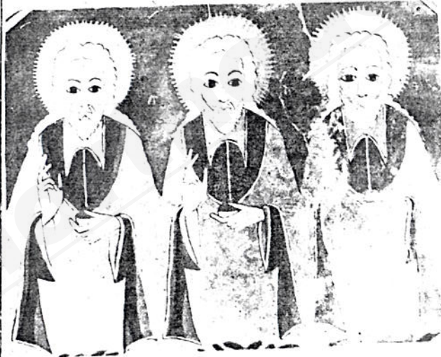
የላግተ የላግ ሥላሴ ዘለለበሙ የላግ ።

ለክርስትና እምነት መሠረቱ ማእከሉና መደምደሚያው ምሥጢረ ሥላሴ ነው ። ክርስትና የተመሠረተ በእግዚአብሔር ሥላሴ ላይ ነውና ። እግዚአብሔር ወልድ ከቅድስት ድንግል ማርያም ሰው ከመሆኑ በፊት ትምህርተ ሥላሴን ያወቀና የተረዳ ማንም አልነበረም ። እግዚአብሔር ወልድ ከቅድስት ድንግል ማርያም በድንግልና ከተወለደ ወዲህ ግን በእግዚአብሔር አንድነት ሦስትነት ። ሦስትነትም አንድነት መኖሩ ተገልጦ ። ስለ እግዚአብሔር አንድነትና ሦስትነት የሚሰጠውን ትምህርት ምንም እንኳን የፍጡር አእምሮ መርምሮ ሊረዳው የማይችል ቢሆንም ከእግዚአብሔር የተገለጠ እውነት ነው ። ይህም እውነት በክርስቲያኖች ዘንድ ጸንቶ ይኖራል ። ምክንያቱም ከክርስትና ሃይማኖት ልዩነት ያላቸው ሃይማኖቶች ሁሉ እግዚአብሔር አንድ ገጽ አንድ አካል ብቻ እንደሆነ ሲያስተምሩ የክርስትና ሃይማኖት ግን እግዚአብሔር በአንድ ነገር በሦስትነት የነበረ ያለና የሚኖር መሆኑን ያስተምራል ። የአሕዛብ ሃይማኖት ብዙኅን አማል ክት እንዳሉ ሲያስተምር የክርስትና ሃይማኖት ግን እግዚአብሔር በሦስትነት ቢገለጥም አንድ አምላክ ነው እንጂ ሦስት አምላክት አለመሆኑን ያረጋግጣል ። ከዚህም ጋር ሌሎች ሃይማኖታቸውን እግዚአብሔር አካላዊ ያልሆነ ዝርዝር ኃይል ስሚታዊ ነገር እንደሆነ ሲያምኑና ሲያስተምሩ የክርስትና ሃይማኖት ተከታዮች ግን እግዚአብሔር ረቂቅ (መንፈስ) ቢሆንም በፈቀደ ጊዜ